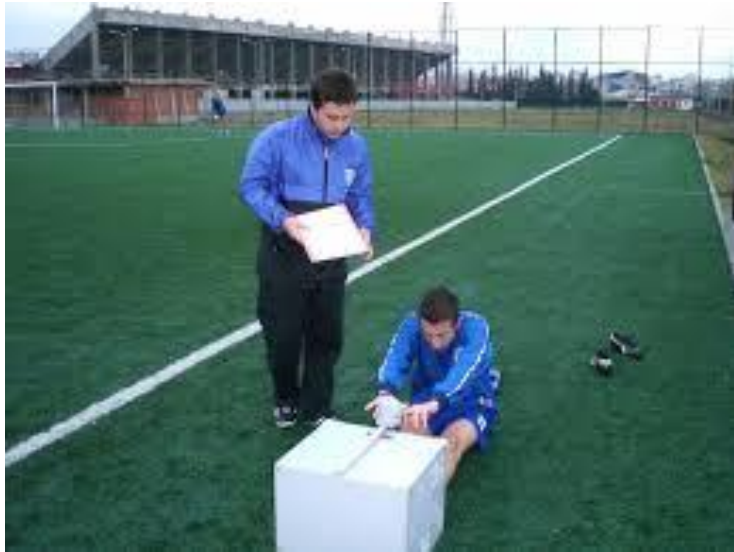
UZAN – ERİŞ TESTİ

Örneğın; 20 cm esnekliğe ulaşan bir aday en iyi dereceyi elde etmiş ise 10 tam puan alırken, 10 cm esnekliğe ulaşan aday 5 puan alır. 30 cm ve üzerine ulaşan adaylar tam puan alır.