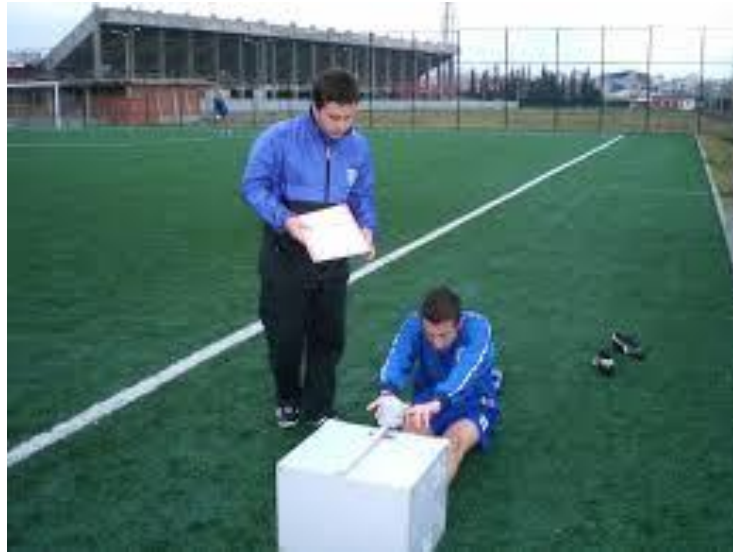
UZAN – ERİŞ TESTİ

Örneğın; 20 cm esnekliğe ulaşan bir aday en iyi dereceyi elde etmiş ise 10 tam puan alırken, 10 cm esnekliğe ulaşan aday 5 puan alır. 30 cm ve üzerine ulaşan adaylar tam puan alır.